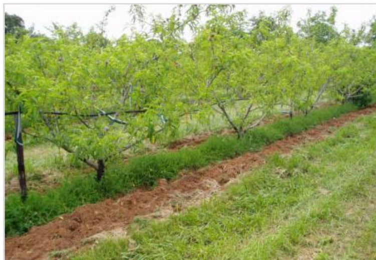
Système sandwich, chambre d'agriculture des Pays de la Loire

Ce système consiste en un travail du sol de chaque côté du rang en laissant une bande centrale enherbée (environ 20 cm). L'enherbement peut être spontané ou semé avec un mélange d'espèces.