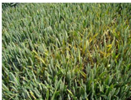
Foyer de rouille jaune

Cependant, des attaques de rouille jaune sur la variété de blé Energo ont été signalées dans quelques parcelles du Brivadois. Il convient donc de surveiller de près cette variété. La rouille jaune se manifeste par l'apparition de pustules de couleur jaune / orangée alignées le long des nervures sur le feuillage. En cas de fortes attaques, ces pustules colorent les bottes ou les roues du tracteur !