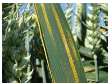
Pustules de rouille jaune sur feuillage