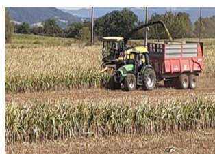
Illustration : Photos au 18 août 2023 : parcelle dans le secteur de Langeac. La bonne décision est d'ensiler. Le maïs est desséché, sa fin de cycle est stoppée.

➔ Dans ce cas, l'objectif prioritaire est de récolter un fourrage avec un minimum de digestibilité. L'ensilage doit intervenir avant le dessèchement complet de la plante, avec l'objectif d'avoir au moins les 5-6 dernières feuilles encore vertes. Si possible, préférer l'affouragement en vert, voire le pâturage.